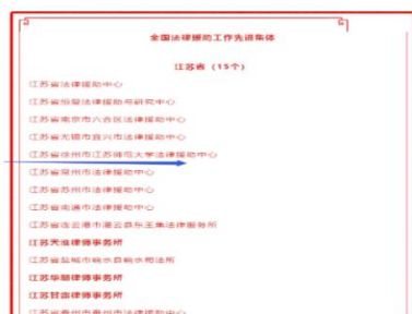
江苏师范大学法律援助中心被司法部评选为“全国法律援助先进集体”

独树一帜的“U+”法律援助实践教学模式。 法学专业以法律援助中心为基础，创立了“U+”法律援助实践教学模式，即以江苏师范大学（University）法律援助中心为依托，通过与法院、检察院、律所、社区、政府机关、社会团体等机构合作，校地深度协同建设体系化的各类实践教学平台，为法律人才培养提供实践资源和机会。我校法律援助志愿者援助的案件先后被《人民法院报》《中国教育报》《江苏法制报》、中央电视台“今日说法”、中国教育电视台、中国法院网等媒体报道。2012 年 12 月，我校法律援助中心被江苏省司法厅、教育厅等评选为“法律援助先进集体”。2015 年 2 月 13 日，《新华日报》报道了我校通过法律援助创新法治人才培养机制的先进经验。2020 年 2 月，我校法律援助中心被司法部评选为“全国法律援助先进集体”。