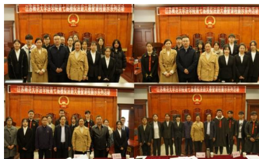
模拟法庭课程展示