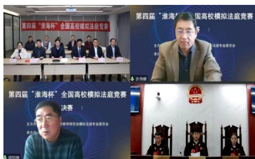
第四届“淮海杯”全国高校模拟法庭竞赛决赛现场

特色鲜明的模拟法庭教学模式。我校模拟法庭由学校投资130余万元建设，2016年9月投入使用。该模拟法庭完全按照真正的法庭设计，硬件与软件设施先进。模拟法庭开展的活动主要包括：承担徐州市各级法院的真正庭审活动；承担“淮海杯”全国高校模拟法庭大赛以及我校模拟法庭课程活动。我校自行设计的模拟法庭课程实施方案因具有案件来源的真实性、指导教师法学理论与法律实务兼具性、参与学生诉讼程序的亲历性、模拟小组不同角色之间的相对隔离性等创新特色，被中国法学会模拟法庭专业委员会向全国法学院系正式推介。中国法学会法学教育研究会模拟法庭专业委员会与我校共同创办的“淮海杯”全国高校模拟法庭竞赛，已经成为具有广泛影响力的年度品牌赛事。