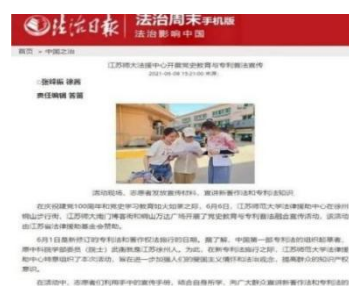
《法制日报》报道法律援助中心普法活动